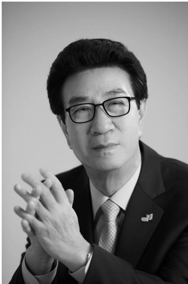
최삼규 대한건설협회 회장